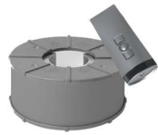
PZ 200 LED St.ung- & Fernbedienung